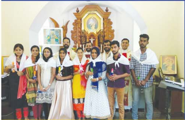
ബാംഗ്ലൂർ ഷേൺസ്റ്റാട്ട് യുവജനങ്ങൾ മാതാവുമായുള്ള സ്നേഹ ഉടമ്പടി നടത്തുന്നു