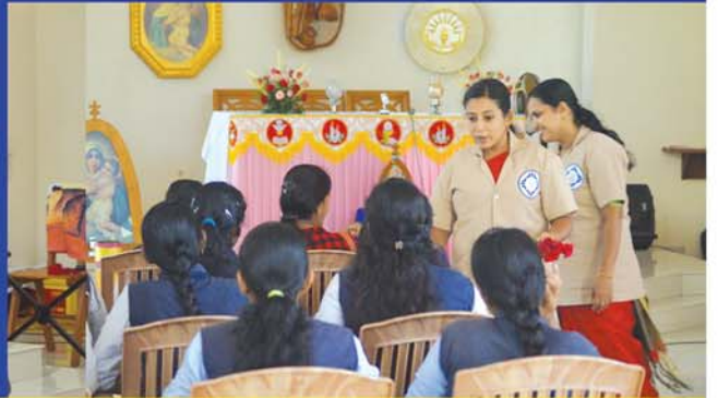
കുറ്റൂർ ഷേൺസ്റ്റാട്ട് അക്കാദമി അദ്ധ്യയനവർഷാരംഭം