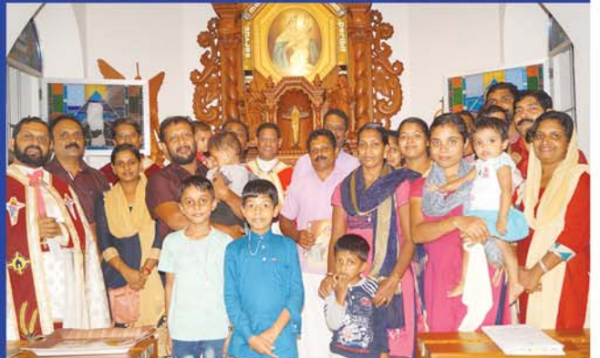
വീരൻചിറ (സെന്റ് ജോസഫ്) ചർച്ച്, ഇരിങ്ങാലക്കുട രൂപത) യിൽ നിന്നുള്ള കുടുംബങ്ങൾ മാതാവുമായി സന്തോഷം ഉടമ്പടി നടത്തിയപ്പോൾ